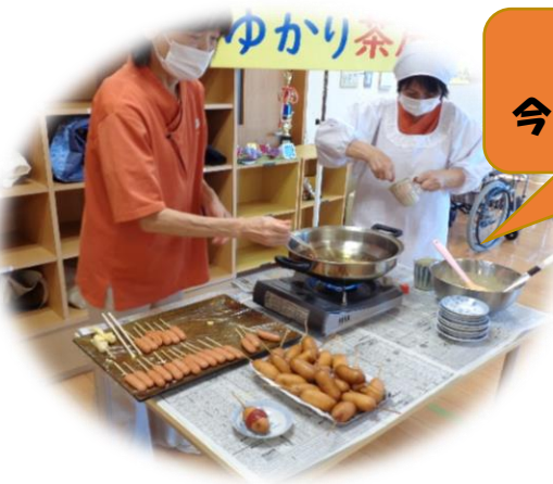
ゆかり茶屋、 今月も大好評でした♪