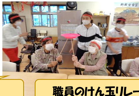
職員のけん玉ルー対決！