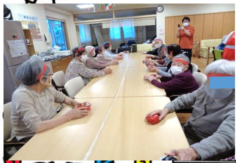
ゆかり式玉入れ対決！