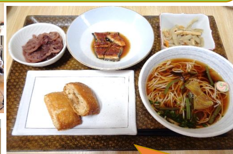
今月のイベント食では うなぎやいな寿司がで ました♪

ゆかりの郷は、皆様と出会えた「縁」を大切に1人ひとりに向き合う支援を目指しています！！